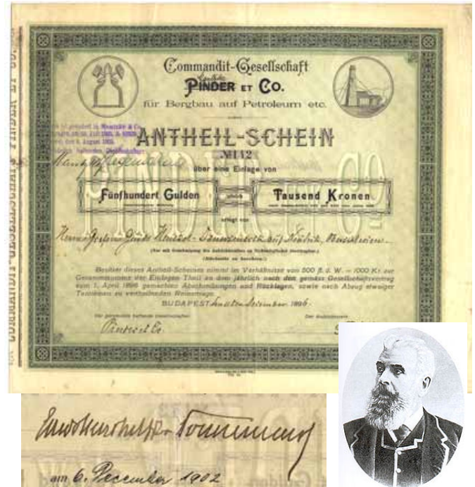
Originalsignatur Fürst Guido Henckel von Donnersmarck