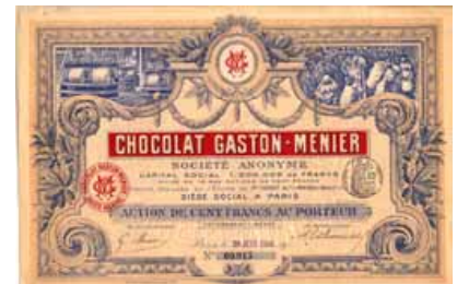
Originalsignatur Gaston Menier